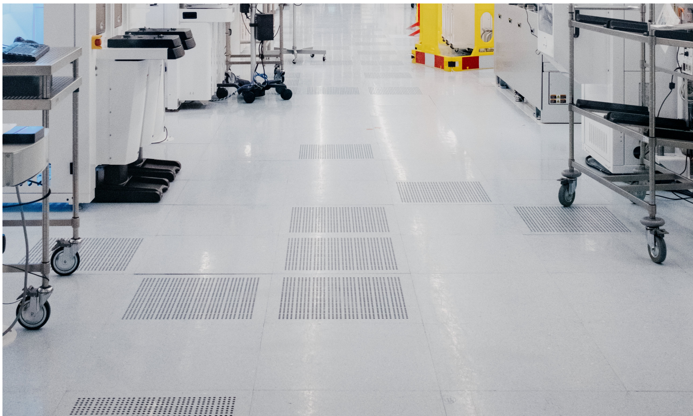
Medewerkers in de imc-cleanroom.